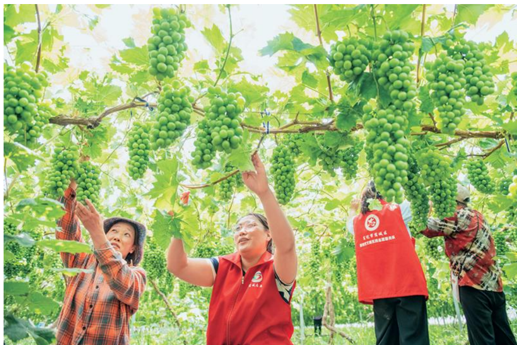
近年来，江苏省宿迁市宿城区支口街道大力实施党建引领强村富民工程，采取“党建+合作社+农户”运作模式，组织党员志愿者走进田间地头生产一线，引导群众因地制宜发展山楂、葡萄等特色产业种植，拓宽增收渠道，助力乡村振兴。图为2023年6月30日，在宿迁市宿城区支口街道探楚社区葡萄种植基地，党员志愿者和果农一起管护葡萄。

国战略。要着力建设世界重要人才中心和创新高地，按照党中央确定的战略布局，突出重点、梯次推进，因地制宜、突出特色，坚持教育发展、科技创新、人才培养一体推进，加快形成人才发展的战略支点和雁阵格局。要加快建设国家战略人才力量，坚定信心走好人才自主培养之路，采取更加积极、更加开放、更加有效的人才政策，做好全方位培养引进用好人才工作。要深化人才发展体制机制改革，坚持放权松绑与约束监督相结合，完善人才评价体系和激励机制，有效激发人才创新创业活力，促进人才区域合理布局和协调发展。要加强对人才的政治引领和政治吸纳，大力弘扬科学家精神，引导广大人才爱党报国、敬业奉献、服务人民。