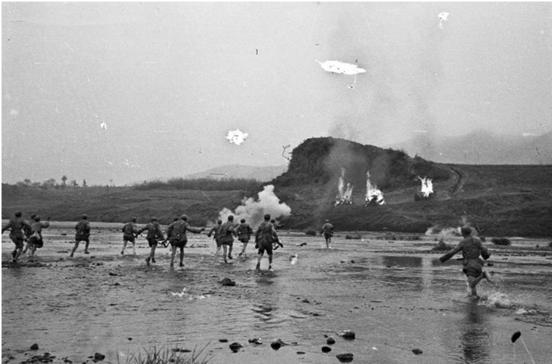
图为1951年4月22日，中国人民志愿军在强大的炮兵配合下，抢占了滩头阵地。解放军画报供图 袁汝逊/摄

抗美援朝战争伟大胜利，是中国人民站起来后屹立于世界东方的宣言书，是中华民族走向伟大复兴的重要里程碑，对中国和世界都有着重大而深远的意义。