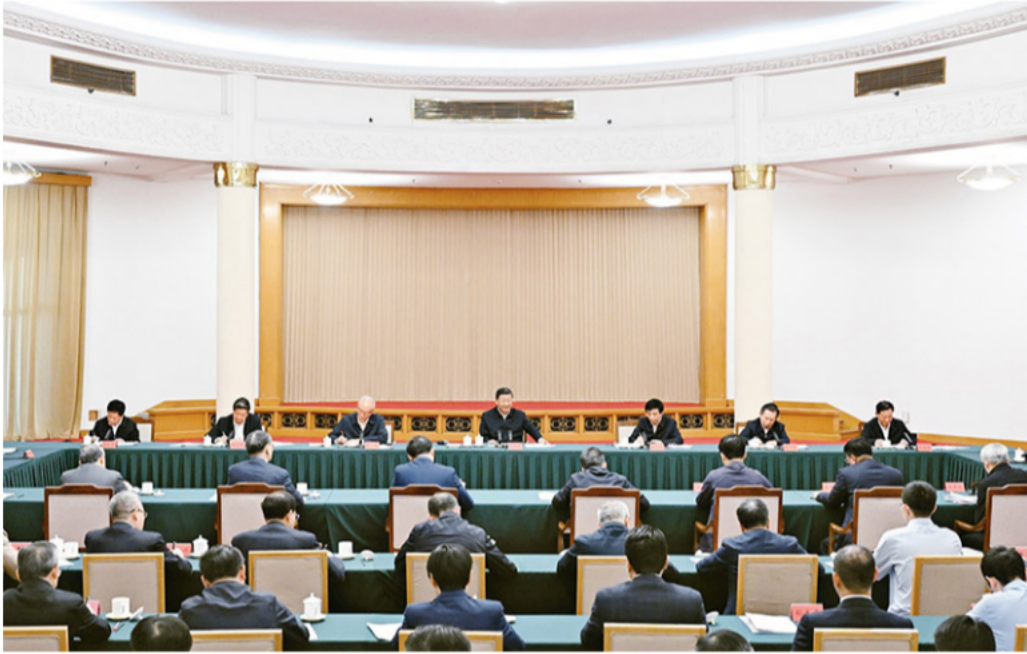
2024年5月23日下午，中共中央总书记、国家主席、中央军委主席习近平在山东省济南市主持召开企业和专家座谈会并发表重要讲话。

在人才发展体制机制改革方面，提出加快建设国家战略人才力量，提高各类人才素质；完善青年创新人才发现、选拔、培养机制，更好保障青年科技人员待遇；强化人才激励机制，坚持向用人主体授权、为人才松绑；完善海外引进人才支持保障机制。